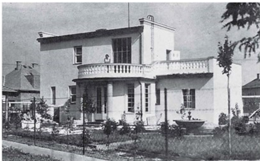
V letech 1931–32 si nechal postavit dle vlastního architektonického návrhu dům v Budyňské ul. č.p. 346

Z kuchyně se podávalo jídlo malým okénkem rovnou do obývacího pokoje. Obývací pokoj byl osvětlen denním světlem prakticky po celý den. Nebyl ochuzen ani o světlo zapadajícího slunce, které se do pokoje dostá-